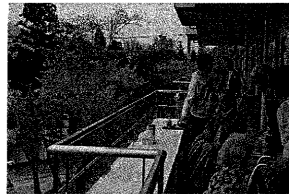
花見会（ウッドデッキ）