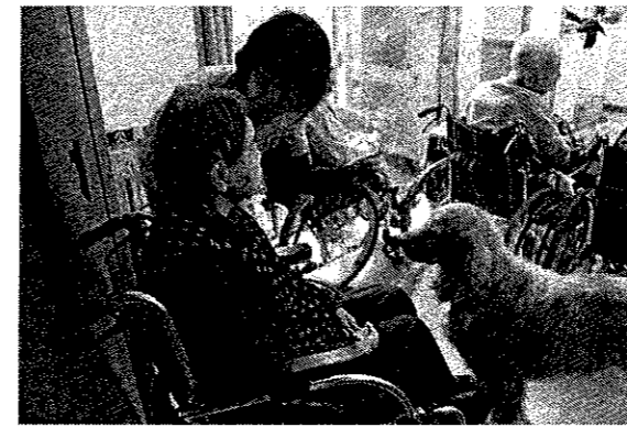
アニマルセラピー