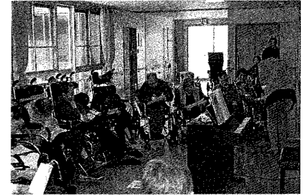
ミュージックケア