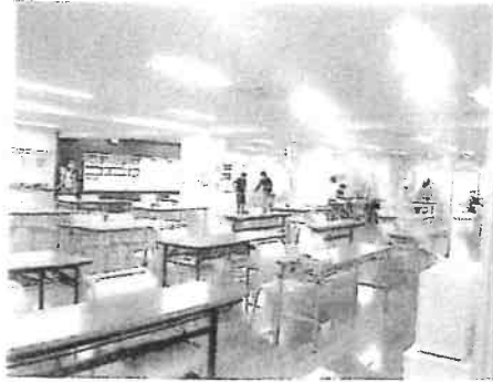
弱酸性次亜塩素酸水の噴霧