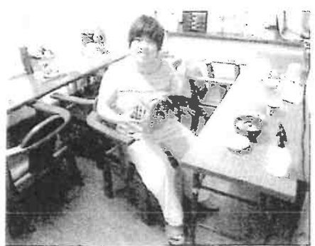
対面での食事を避ける