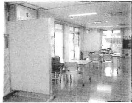
パーティションを購入