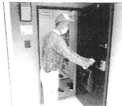
人の触れる場所の消毒